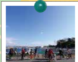
2个小时轻松地绕岛一周

在一周5.5公里的岛上,可以骑着自行车,在海风的吹拂下绕岛一周。途中,还可以顺路去各个绝佳的景点以及土特产商店。