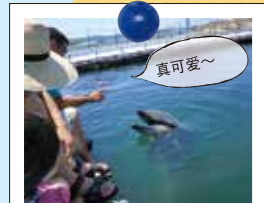
让可爱的海豚抚慰您的心灵

可以向南知多海滨乐园的饲养员了解有关海豚的生态状况,并抚摸在西滨海水浴场遨游的海豚。