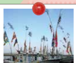
有千年以上历史的祭祀节

神社的神官将在岛中捕获的鯛鱼用盐腌制成“御币鯛”供奉给伊势神宫内宫,每年3次。其中与伊势神宫的神尝节合在一起隆重举行的就是10月12日的“御祭鯛奉纳节”。